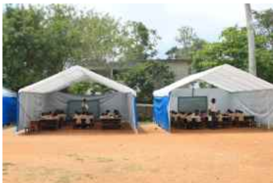
Provisorischer Unterricht in von Plan aufgestellten Schulzelten.

Zwar war der Nordosten vom Erdbeben selbst kaum betroffen, allerdings ziehen immer mehr Menschen aus Port-au-Prince und Umgebung in diesen Teil des Landes. Die Migrationsbewegungen haben Einfluss auf Plans Arbeit in der Region. Derzeit entwickelt das Plan-Team eine Strategie für die Projektarbeit in und um Cap Haiti für die nächsten Wochen.