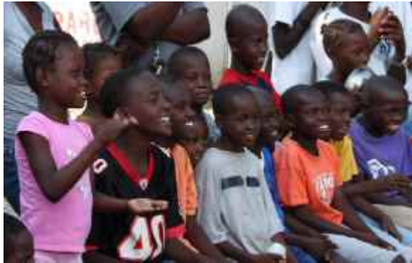
In den kinderfreundlichen Zonen erfahren Kinder, wie sie sich schützen können.

Die körperliche und geistige Gesundheit und das Wohlbefinden von Kindern, Jugendlichen und Familien im Erdbebengebiet fördern; die Zahl der Kinder und Frauen, die Zugang zu Gesundheitsdiensten haben, erhöhen