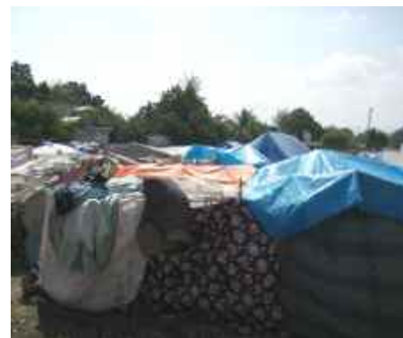
Plan fokussiert die Verbesserung der sanitären Situation.

Der Schwerpunkt von Plans Maßnahmen zur Sicherung der unmittelbar lebensnotwendigen Bedürfnisse hat sich von der Bereitstellung von Notunterkünften und Hilfsgütern hin zu Wasser- und Sanitärprojekten, Bildungsinitiativen und Kinderschutzmaßnahmen verschoben. Plan prüft weiterhin in den Camps, wo Latrinen benötigt werden. Darüber hinaus baut Plan Latrinen für provisorische Schulen.