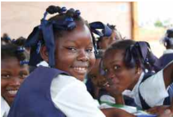
Schule gibt den Kindern ein Stück Normalität zurück.

Im vergangenen Monat konzentrierte sich Plans Arbeit im Bildungsbereich darauf, Schülerinnen und Schüler, Eltern, Gemeinden und Bildungsbehörden auf die Wiedereröffnung der Schulen Anfang April vorzubereiten. Während die Regierung zunächst alle Schulen zu einem Schulbeginn am 5. April 2010 gedrängt hatte, ist sie inzwischen davon abgerückt, kurzfristige, feste Fristen zu setzen. Das ermöglicht mehr Flexibilität bei der Analyse der Situation vor Ort, sodass geeignete Maßnahmen definiert werden können.