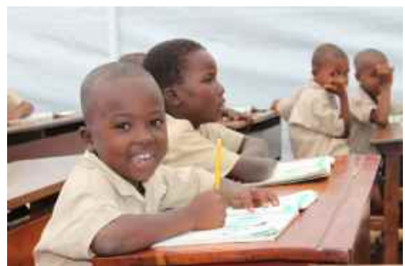
Der Schulunterricht findet in den provisorischen Schulzelten statt.