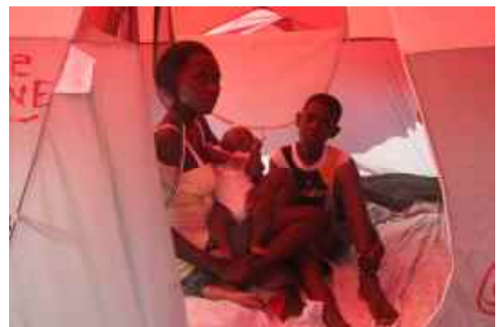
Viele Familien sind in provisorischen Unterkünften untergebracht.

Da die Regenzeit und Hurrikansaison näher rücken, ist die Unterbringung der betroffenen Bevölkerung in geeigneten Unterkünften besonders dringend. In Kürze werden Familien, die unter prekären Bedingungen in vorhandenen Camps leben, in neue Camps umgesiedelt, zum Beispiel nach Tabarre Issa und Corail Cesselesse.