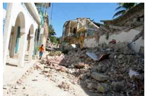
Die Gebiete um Port-au-Prince bleiben Erdbeben gefährdet.

Besonderer Wert wird in Zukunft darauf gelegt, den Katastrophenschutz in das Bildungssystem zu integrieren. Plan unterstützt daher den Bau von katastrophensicheren Schulgebäuden, die Entwicklung von Notfallplänen an Schulen, Aufklärungskampagnen in Gemeinden und Camps, Fortbildungen zur Stärkung der Kompetenzen von staatlichen Behörden sowie Lobbykampagnen auf nationaler Ebene einschließlich der Aufnahme des Katastrophenschutzes in den Lehrplan an Schulen. Im Mittelpunkt von Plans Strategie zum Katastrophenschutz steht die Stärkung der Kompetenzen der zivilen Gesellschaft, der Jugendlichen und Kinder in diesem Bereich. Plan arbeitet im Katastrophenschutz weiterhin mit dem Zivilschutz, dem Roten Kreuz und den lokalen Behörden zusammen.