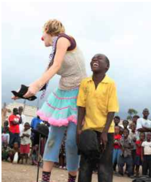
Clowns Without Borders in den Camps.

Im Rahmen der erfolgreichen Partnerschaft mit Clowns Without Borders gab es im März 20 Clown-Aufführungen in Camps, Schulen und Gemeindezentren in Jacmel und Croix-des-Bouquets, die von mehr als 6.000 Kindern besucht wurden. Die Kinder hatten bei den Vorstellungen sehr viel Spaß. Derzeit plant das Kinderhilfswerk, im Juni weitere Aufführungen zu organisieren.