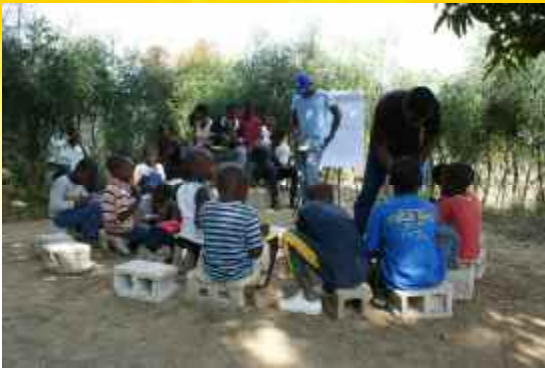
Ein Plan-Mitarbeiter formuliert mit den Kindern ihre Wünsche.

Das sind die wichtigsten Ergebnisse der Umfrage: