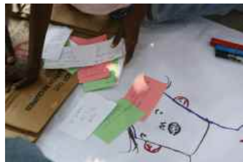
Junge Menschen entwerfen ein neues Haiti.

Plan tritt dafür ein, dass die Ansichten von Kindern und Jugendlichen in den nationalen Wiederaufbauplänen berücksichtigt werden. Zusammen mit UNICEF organisierte Plan Arbeitsgruppen mit fast 1000 Kindern und Jugendlichen zwischen fünf und 24 Jahren. Der Abschlussbericht mit dem Titel „Anticipating the Future: Children and Youth People's Voices in Haiti's Post Disaster Needs Assessment (PDNA)“ wurde am 30. März 2010, einen Tag vor der internationalen Geberkonferenz, bei einer Nebenveranstaltung in New York vorgestellt.