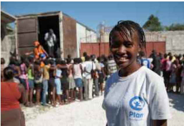
Plan legt einen großen Wert darauf, Jugendliche einzubinden.

Am 27. März fand eine Schulung für die Jugendlichen in den kinderfreundlichen Zonen statt, in denen sie lernten, Aktivitäten für die Kinder zu organisieren.