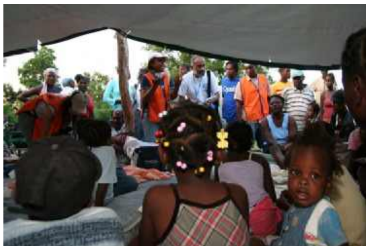
Eine von Plan organisierte Notunterkunft in Jacmel bietet allen Schutz.

In Jacmel wurden Zelte in Raquette, Siloé, Loge, Aviation, Place T.L, Saint Hélène, Sous l'hôpital, Quartier St Anne, Rue Conty, Labidou, Lamandou, La vallée und Bainet verteilt.