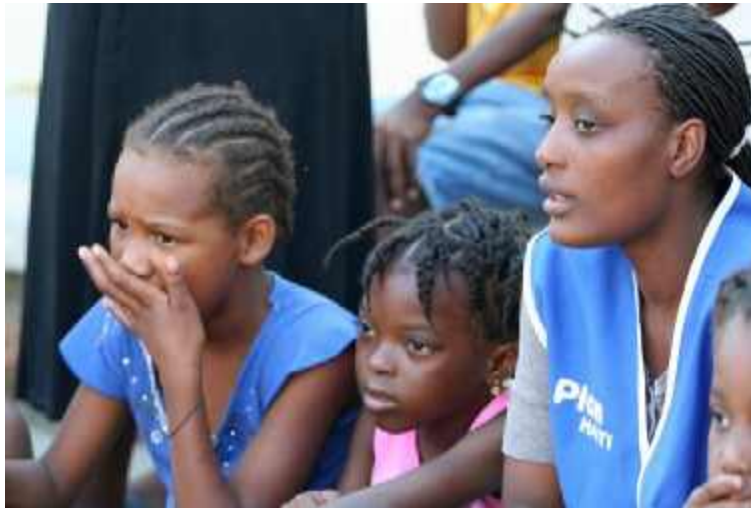
Fassungslosigkeit, Trauer und Ratlosigkeit sind immer noch gegenwärtig.