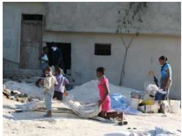
In den Trümmern suchen die Menschen in Haiti nach Verwertbarem.

Nach dem Erdbeben haben viele Menschen Port-au-Prince verlassen und sind in ländliche Gegenden gezogen - auch in den Nordosten Haitis, wo Plan arbeitet. Plan stimmt sich im Nordosten mit anderen Nichtregierungsorganisationen und den lokalen Behörden ab. In den Gemeinden Fort Liberté, Ouanaminthe, Carice und Trou du Nord übernahm Plan die Aufgabe, einen Überblick über die Migranten aus den Erdbebengebieten zu bekommen. In Carice führte Plan auch Programme zur psychosozialen Betreuung durch.