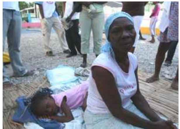
Aus Angst vor Nachbeben wird im Freien übernachtet.

Vor Ort beteiligt Plan sich an der Koordinierung der Hilfsmaßnahmen. Beispielsweise arbeitet Plan in Koordinierungsstellen der Vereinen Nationen mit, nimmt an Beratungen mit der Landesregierung und Lokalregierungen teil und stimmt sich im Bedarfsfall mit militärischen Truppen ab.