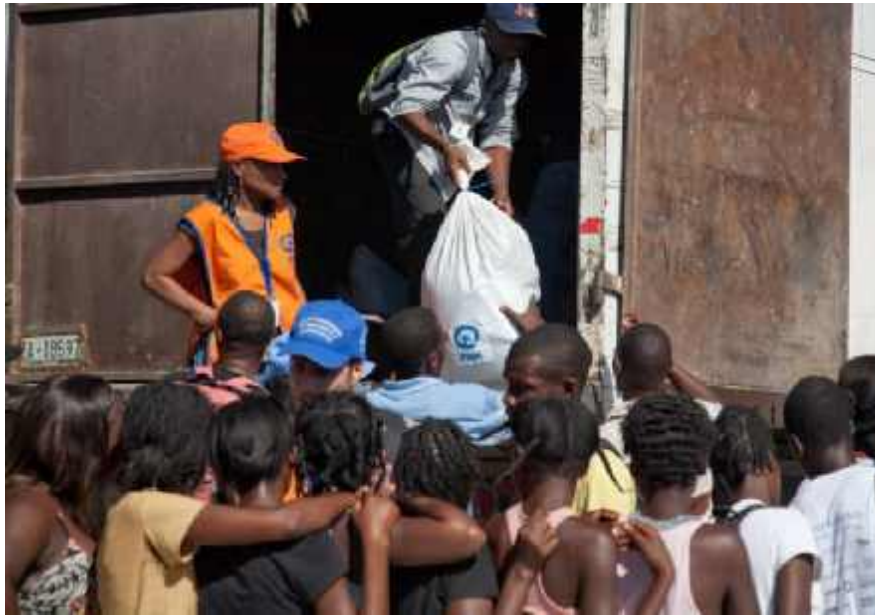
Plan-Mitarbeiter verteilen Nahrungsmittel in den betroffenen Gemeinden.

** In den ersten Tagen nach der Katastrophe wurden in Jacmel folgende Nahrungsmittel verteilt: 122 Säcke Reis, 52 Kartons Hering, 10 Kartons Sardinen, 84 Gallonen Speiseöl, 20 Kartons Butter, 20 Kartons Tomatenpaste.