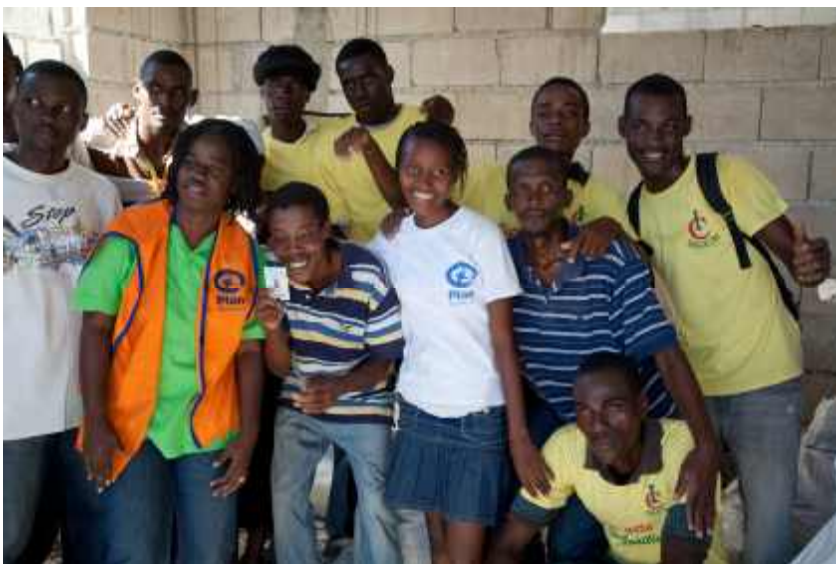
Plan bindet jugendliche Freiwillige in die Soforthilfe und den Wiederaufbau ein.