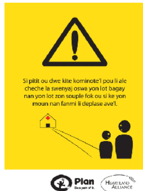
Plakate, die in Kreol über Kinderhandel aufklären.