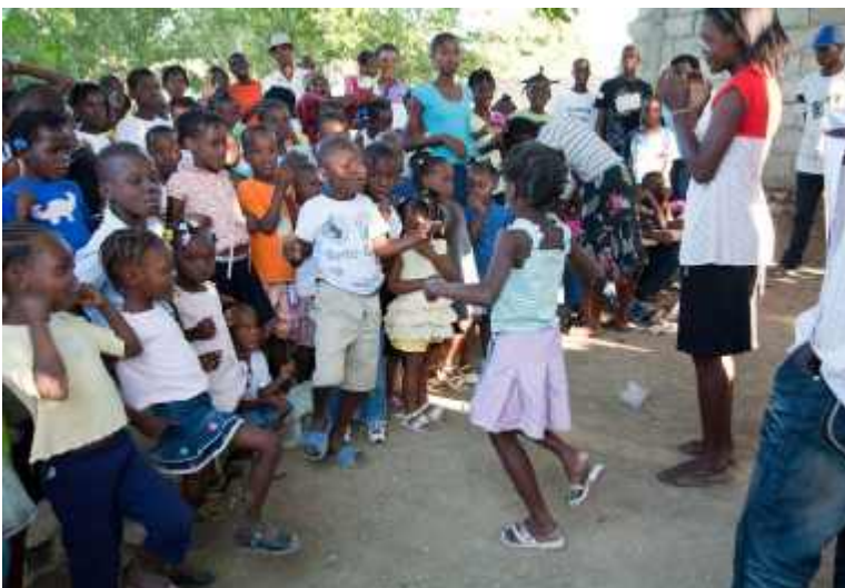
In kinderfreundlichen Schutzräumen können Kinder ungestört spielen.