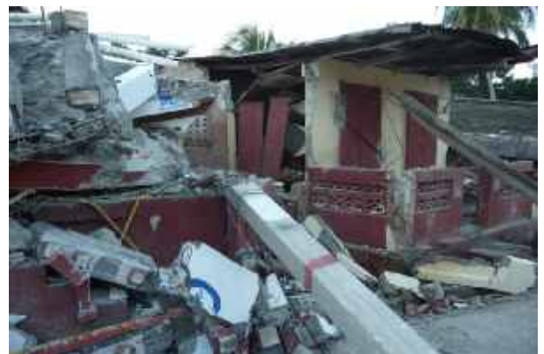
Eine von Plan errichtete Vorschule - nun vom Erdbeben zerstört.

Am 14. März 2010 besuchte UN-Generalsekretär Ban Ki Moon zusammen mit einer hochrangigen Delegation Haiti, um sich selbst ein Bild von den Fortschritten zu machen, die seit seinem letzten Besuch im Januar erreicht wurden. Ban Ki Moon hob besonders die Fortschritte bei der Nahrungsmittel- und Wasserversorgung für die notleidende Bevölkerung hervor. Er erneuerte das Versprechen der Vereinten Nationen, die haitianische Regierung während des Übergangs von den Not- und Übergangshilfe zu Wiederaufbauprogrammen zu unterstützen. Nach einem Besuch in einem Notcamp in Petionville erklärte der Generalsekretär, die größte Herausforderung sei es, Unterkünfte für die vielen Obdachlosen zu schaffen. Des Weiteren sprach Ban Ki Moon mit Präsident Préval über die für den 31. März 2010 geplante internationale Geberkonferenz am Hauptsitz der Vereinten Nationen in New York. Haiti braucht vor allem finanzielle Mittel für Schulen, Infrastruktur, Straßen und Elektrizitätsversorgung.