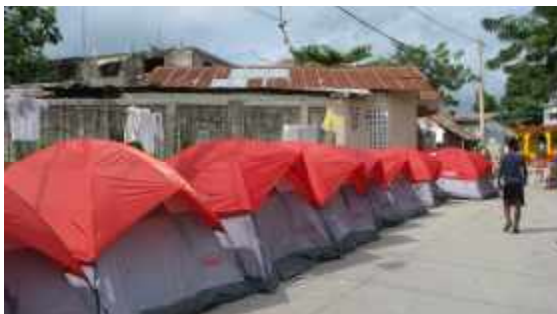
Leben in Notunterkünften.