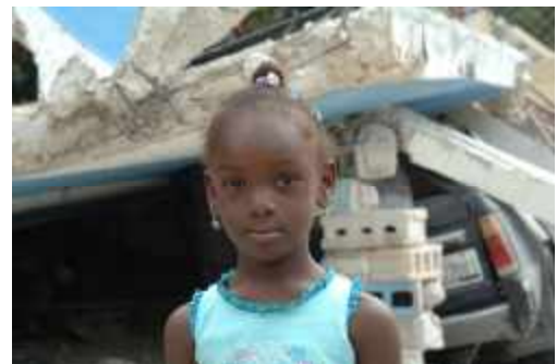
Für betroffene Kinder besteht ein hohes Trauma-Risiko.