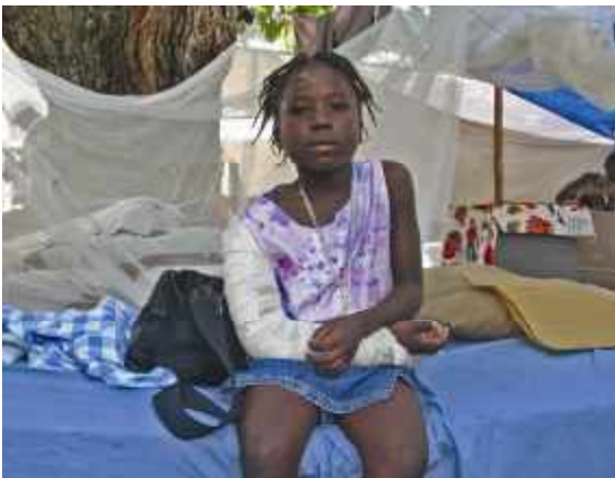
Tausende Kinder haben Brüche erlitten. Medizinische Versorgung fehlt.