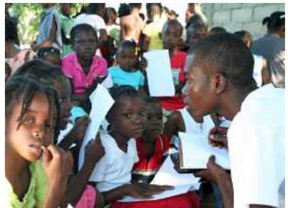
Kinder und Jugendliche beteiligen sich am nationalen Wiederaufbau.

Vertreter von Plan Haiti beteiligten sich an einem runden Tisch in Miami am 18. März 2010 sowie an einem Treffen am 19. März in Port-au-Prince, bei dem über den Bedarf während der Wiederaufbauphase diskutiert wurde. Plan ist im Austausch mit anderen Nichtregierungsorganisationen, um die Wiederaufbaugespräche am 24. März in Washington mit den Wünschen und Vorstellungen der Kinder und Jugendlichen zu ergänzen.