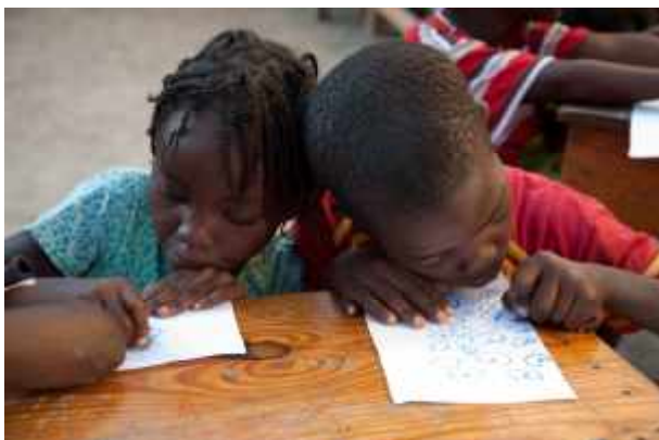
Plan: das körperliche und seelische Wohl der betroffenen Kinder fördern.

Während die Katastrophe zunächst die gesamte Bevölkerung in den Erdbebengebieten betraf, werden Kinder, Frauen, die arme Bevölkerung und die Menschen in ländlichen Regionen langfristig am stärksten unter den Folgen des Bebens leiden und am längsten brauchen, um die Auswirkungen zu bewältigen. Diese Bevölkerungsgruppen lebten auch vor dem Erdbeben bereits unter besonders schwierigen Umständen. Es ist wahrscheinlich, dass die Ungleichheiten innerhalb der Bevölkerungsgruppen und zwischen den Geschlechtern noch weiter zunehmen werden.