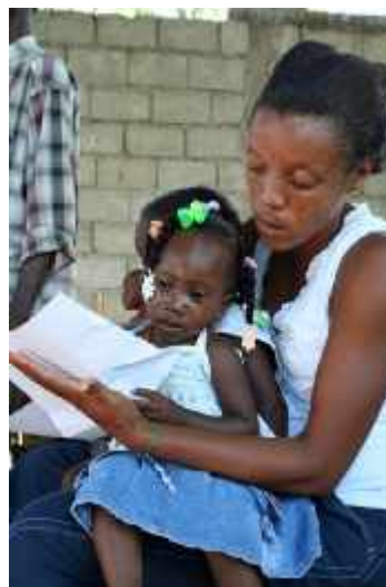
Psychosoziale Betreuung für die Kleinen.