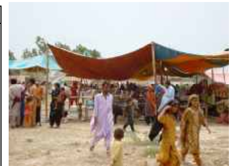
Alltagsleben im Camp.