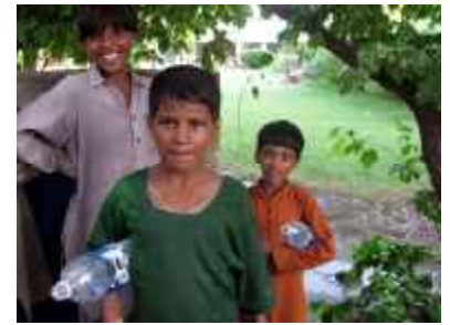
Kinder holen Wasser in Petflaschen.