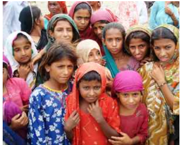
Mädchen in einer Notunterkunft in Thatta, Sindh.