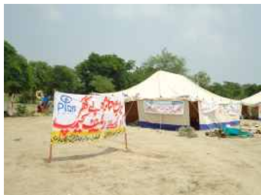
Eine von Plan zur Verfügung gestellte Notunterkunft.

Seit 2009 unterstützt Plan Deutschland ein Katastrophenvorsorge-Projekt in sechs Distrikten der Provinzen Punjab und Sindh. Ein wichtiges Ziel des Projektes ist, die Fähigkeit der Gemeinden und lokalen Regierungsstellen zu stärken, um auf eine Katastrophe schnell und effektiv reagieren zu können. Mit seinen lokalen Partnern des Indus-Konsortiums hat Plan bereits vor den verheerenden Überschwemmungen besonders gefährdete Gebiete identifiziert und diese veröffentlicht. Ein Frühwarnsystem wurde mithilfe der Gemeinden und anderen Netzwerken entwickelt und konnte kurz nach Einsetzen der Fluten angewendet werden. In kürzester Zeit war es daher möglich, die Betroffenen schneller zu erreichen und mit der benötigten Hilfe zu unterstützen.