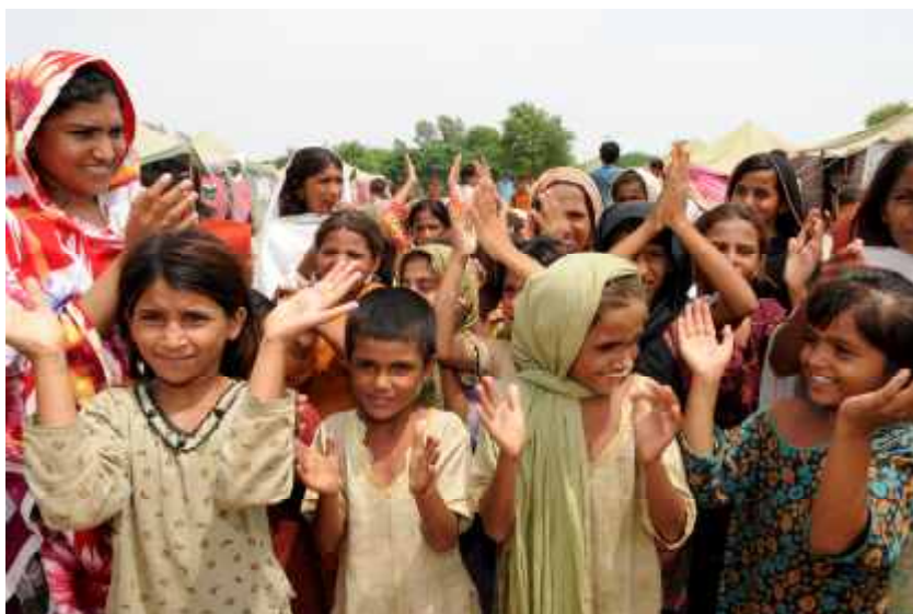
Spiele helfen Kindern, ihren Alltag in den Camps zu vergessen.