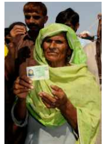
Eine Frau mit ihrem Ausweis.