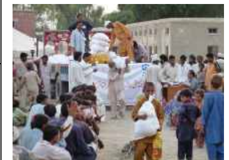
Plan verteilt Nahrungsmittel.