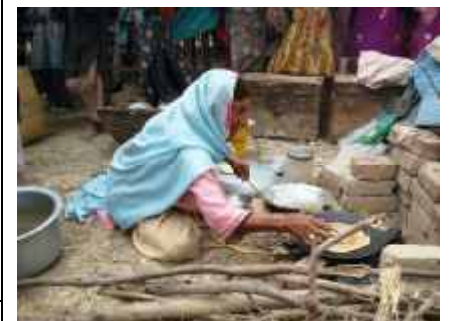
Chapatti – Fladenbrot für alle.