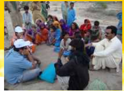
Informationsveranstaltungen von Plan.