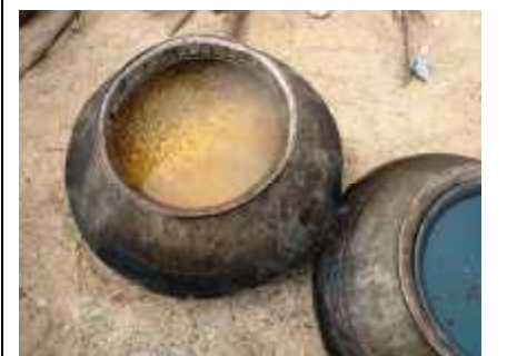
Zubereitung in Gemeinschaftskochtöpfen.