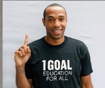
Thierry Henry (FC Barcelona)

Viele Fußballstars und Prominente sind dem Aufruf bereits gefolgt. Mit dabei sind Fußballgrößen wie Sir Bobby Charlton, Anthony Baffoe, Mikael Silvestre, Zinédine Zidane, Gary Lineker, Thierry Henry und viele mehr. Offizielle Botschafterin der Kampagne ist Königin Rania von Jordanien. In Deutschland wird 1GOAL von der Globalen Bildungskampagne, der deutschen Sektion der GCE, durchgeführt.