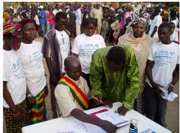
Ein großer Erfolg im vorherigen Projekt war die Erklärung von 25 Gemeinden, in Zukunft auf die weibliche Genitalverstümmelung zu verzichten.