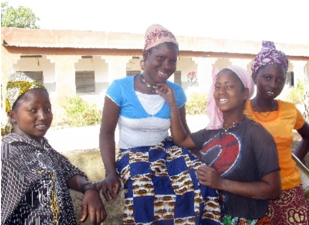
Mädchen sollen ihr Recht auf körperliche Unversehrtheit wahrnehmen können.