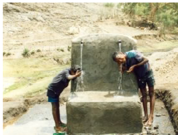
Sauberes Trinkwasser durch Brunnenbau.

Äthiopien ist eines der trockensten Länder der Erde. Die Trinkwasserversorgung ist besonders auf dem Land problematisch: Nur elf Prozent der ländlichen Bevölkerung haben Zugang zu sauberem Wasser. Um diese Situation zu verbessern, bohrte Plan im vergangenen Finanzjahr neue Brunnen und stellte den Gemeinden einfache Handpumpen zur Verfügung. Das Kinderhilfswerk half auch bei der Sanierung nicht mehr funktionsfähiger Trinkwassersysteme. Mehr als 16.000 Menschen profitierten von neuen bzw. verbesserten Wassersystemen.