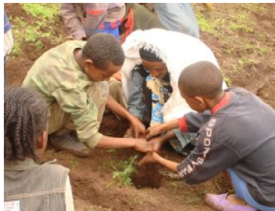
Schüler legen einen Gemüsegarten an.

Für 104 Haushalte stellte Plan Jungkühe zur Gewinnung von Milch und zur Zucht zur Verfügung. Weitere Familien erhielten Schafe, Ziegen, Hühner und Bienen für Zuchtprojekte.