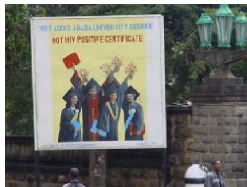
Aufklärungskampagne gegen HIV

Viele Menschen verlieren bedingt durch HIV und Aids ihre Arbeit und bleiben ohne Einkommen zurück. Deshalb betreibt Plan Äthiopien Projekte zur Einkommenssicherung für HIV-infizierte Frauen und Männer. Das Kinderhilfswerk organisierte zum Beispiel Nähkurse und stellte dafür Nähmaschinen zur Verfügung.