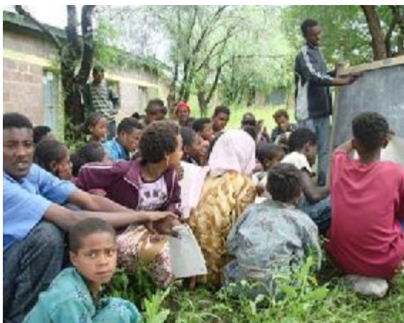
Bildung ist ein Grundrecht.

Viele Kinder in Äthiopien verlassen bereits nach der ersten Klasse die Grundschule, ohne lesen oder schreiben zu können. Plan unterstützt deshalb mehr als 30 alternative Lernzentren, in denen Schulabbrecher gefördert werden. Im vergangenen Finanzjahr sorgte Plan für die Ausbildung von Lehr- und Betreuungspersonal und stattete diese Einrichtungen mit Möbeln, Unterrichtsmaterialien und Schreibwaren aus.