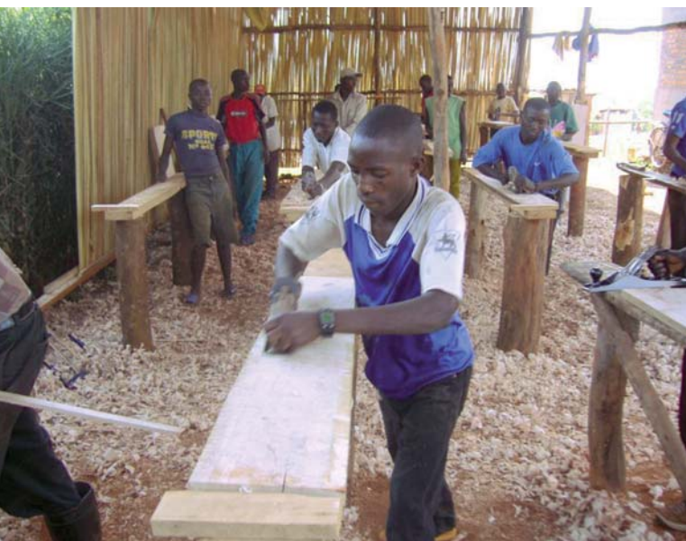
Jugendliche in einer Ausbildungsstätte für Tischler in Gatsibo.