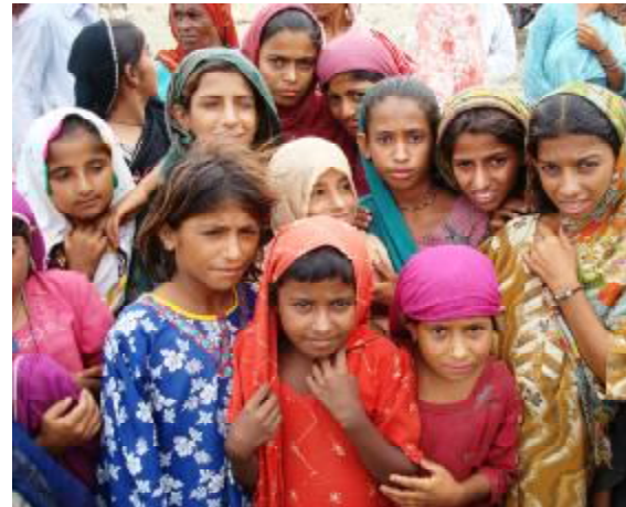
Mädchen in einer Notunterkunft in Thatta, Sindh.