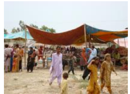
Alltagsleben im Camp.