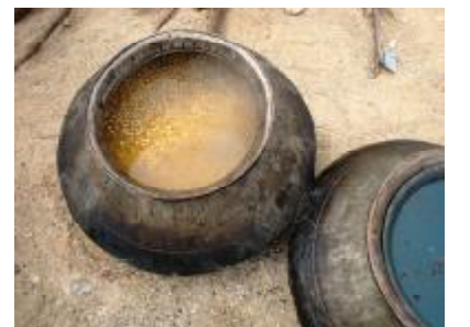
Zubereitung in Gemeinschaftskochtöpfen.