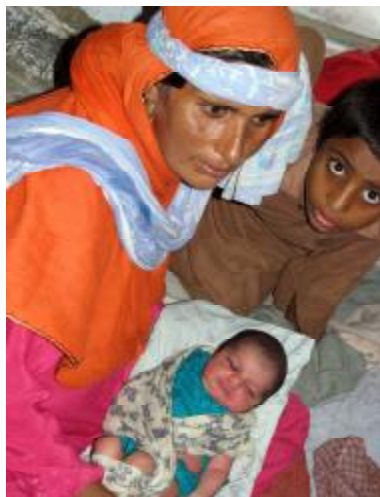
An Druchfall sterben viele Kleinkinder.

Nach wie vor besteht ein großer Bedarf an Notunterkünften. Die Registrierung der Flutopfer stellt zunehmend eine Herausforderung dar, da viele Familien wegziehen oder eine andere Notunterkunft aufsuchen. Eine große Anzahl an Menschen will wieder zurück in ihre Heimatdörfer. Dort werden sie vorerst in Zelten leben müssen, bis sie ihre Häuser wieder aufgebaut haben. Eine ebenso große Anzahl von Menschen wird nicht zurückkehren können und weiterhin in den Camps bleiben.