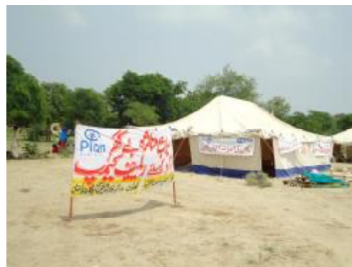
Eine von Plan zur Verfügung gestellte Notunterkunft

Seit 2009 unterstützt Plan Deutschland ein Katastrophenvorsorge-Projekt in sechs Distrikten der Provinzen Punjab und Sindh. Ein wichtiges Ziel des Projektes ist, die Fähigkeit der Gemeinden und lokalen Regierungsstellen zu stärken, um auf eine Katastrophe schnell und effektiv reagieren zu können. Mit seinen lokalen Partnern des Indus-Konsortiums hat Plan bereits vor den verheerenden Überschwemmungen besonders gefährdete Gebiete identifiziert und diese veröffentlicht. Ein Frühwarnsystem wurde mithilfe der Gemeinden und anderen Netzwerken entwickelt und konnte kurz nach Einsetzen der Fluten angewendet werden. In kürzester Zeit war es daher möglich, die Betroffenen schneller zu erreichen und mit der benötigten Hilfe zu unterstützen.