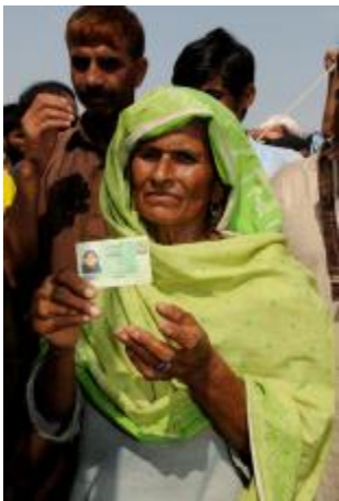
Eine Frau mit ihrem Ausweis.