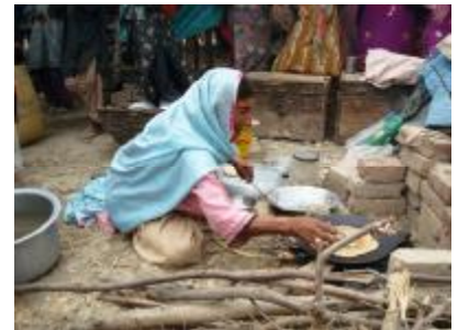
Chapatti – Fladenbrot für alle.