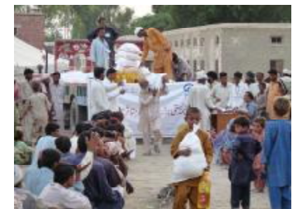
Plan verteilt Nahrungsmittel.