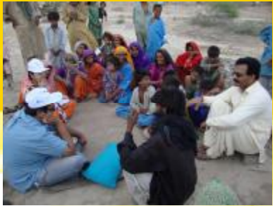
Informationsveranstaltungen von Plan.