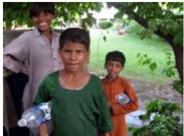
Kinder holen Wasser in Petflaschen.